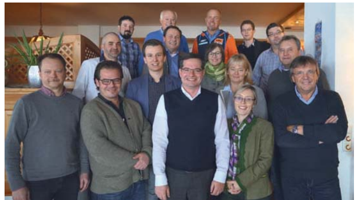
Strategieworkshop mit Ausschussmitgliedern der Fuschlseeregion und einigen Tourismusinteressierten

Das neue Regionsbüro der Fuschlseeregion wurde im Oktober 2017 eröffnet und erfreut sich regem Zuspruch. Aber auch das Thema Winter wurde im Bereich Langlauf, Schneeschuh, Winterwandern etc. vertiefend behandelt. Weitere Schwerpunkte wie Gastronomie und E-MTB wurden neben zahlreichen anderen brennenden Themen ausführlich besprochen.